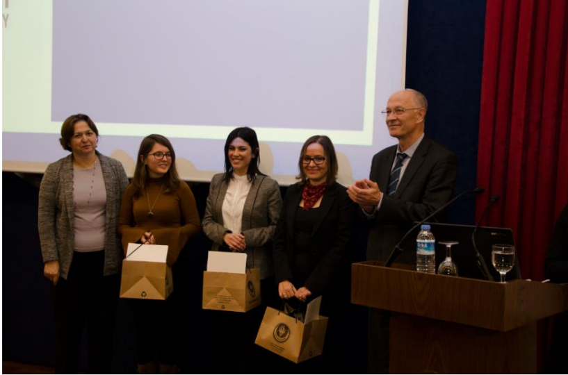
Türkiye'de Çocuk Olmak II - Çocuk İstismarı Semineri